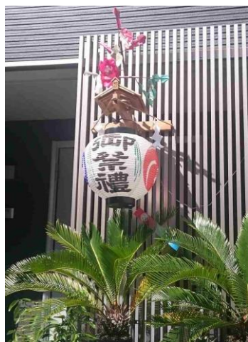
※中野では3連休にお祭りがありました