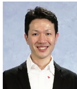
ケアプロ株式会社 代表取締役 看護師 保健師

これからも誰もがあたりまえに健康になれる社会の実現に向けて全力を尽くしていきます。