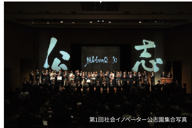
第1回社会イノベーター公志園集合写真

2011年1月22日に行われた 第1回社会イノベーター公志園にて 審査員特別賞を受賞しました。