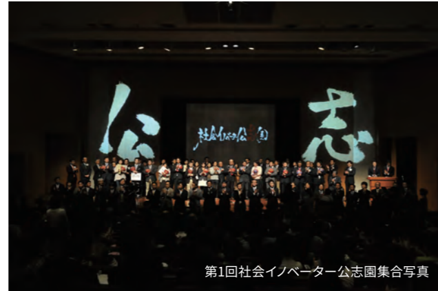
第1回社会イノベーション公志園集合写真

2011年1月22日に行われた 第1回社会イノベーション公志園にて 審査員特別賞を受賞しました。