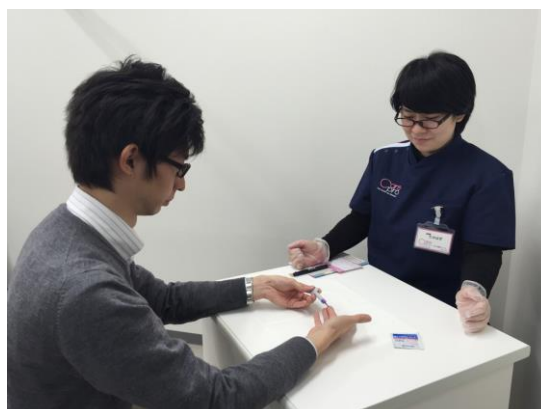
検査の様子(イメージ)

昨年4月、厚生労働省により制定された検体測定室ガイドラインに基づく「利用者自身による採血・消毒」等を条件とした、医療行為に該当しない施設です。