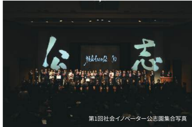
第1回社会イノベーション公志園集合写真

2011年1月22日に行われた 第1回社会イノベーション公志園にて 審査員特別賞を受賞しました。