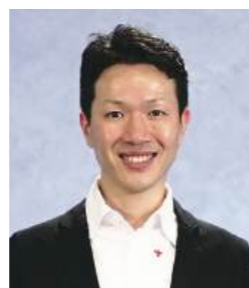
ケアプロ株式会社 代表取締役 看護師 保健師

これからも誰もがあたりまえに健康になれる社会の実現に向けて全力を尽くしていきます。