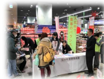
立川市の市民向けPRイベント